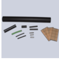
Liitossarja ELVB- SRV-Ramp